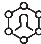
GESTION SOUS CONTRAINTES PRUDENTIELLES Gestion sous contraintes prudentielles