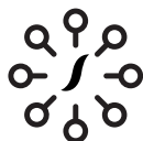
GESTION COLLECTIVE OPCVM et FIA

Salamandre AM décline ses expertises au travers de trois métiers : la gestion collective, la gestion sous mandat et le conseil en investissement.